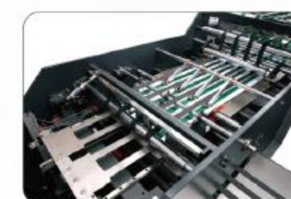
输送部 Conveyor unit

CHM-A4-2 A4复印纸双回旋刀切纸机令纸生产线螺旋线刀槽搭配无间隙齿轮, 实现了世界上最先进的双回旋同步剪切的切断新工艺, 是集令纸分切、包装、令纸包装箱自动化一体的复印纸加工生产设备。