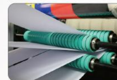
导纸设备 Web guide system