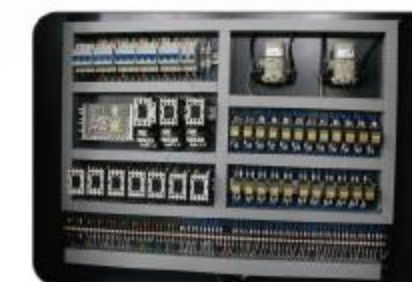
电器设备 Electrical equipment