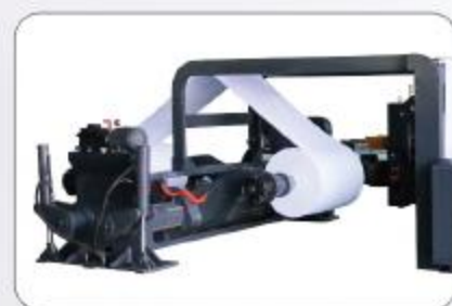
可选配置: 双臂油压无轴原纸架 Optional: Hydraulic Shaftless Unwind station