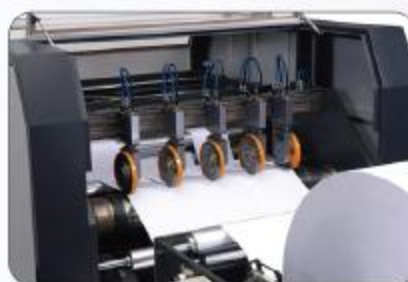
分条刀 Slitting knife